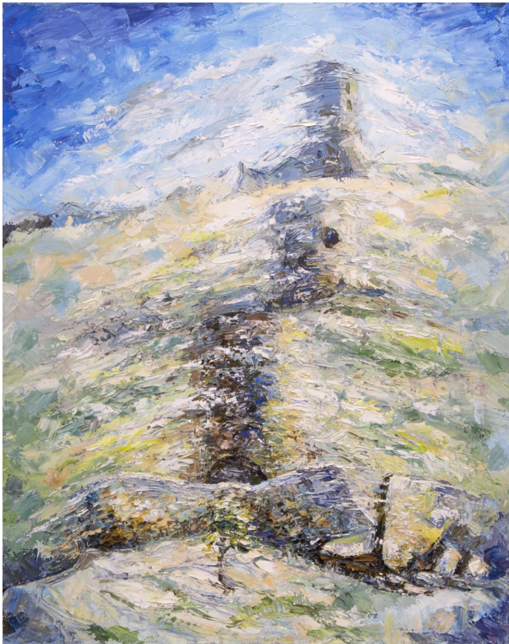
Балаклава. Генуэзские башни Холст, масло, 79x100 см, 2004