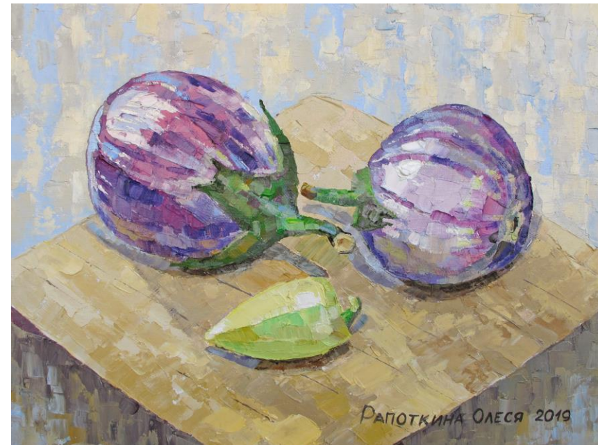
Баклажаны. Перец Холст на оргалите, масло, 40x30 см, 2019