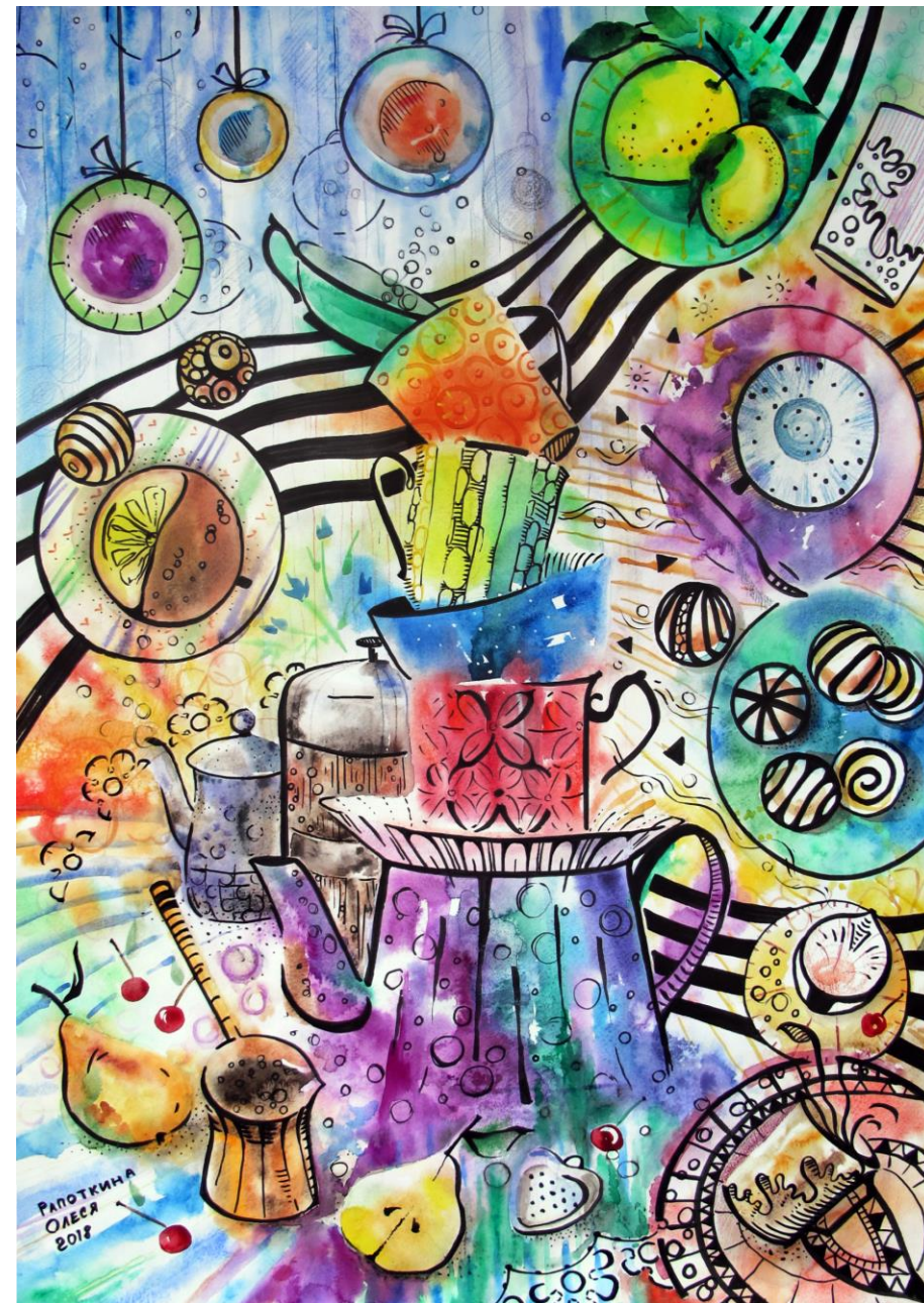
Завтрак Серия из 2х работ. Акварель 2. Бумага, акварель, 59,4x84,1 см, 2018