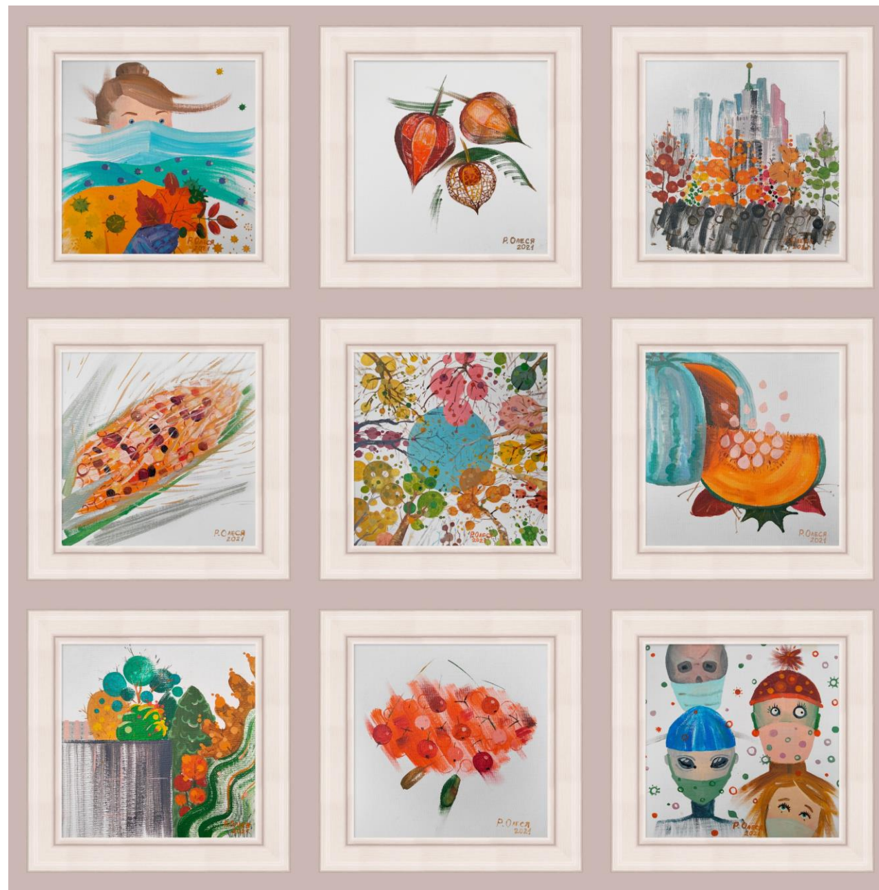
Вторая ковидная осень. 2021 Серия из 9 работ. Холст на картоне, масло, 20x20 см, 2021