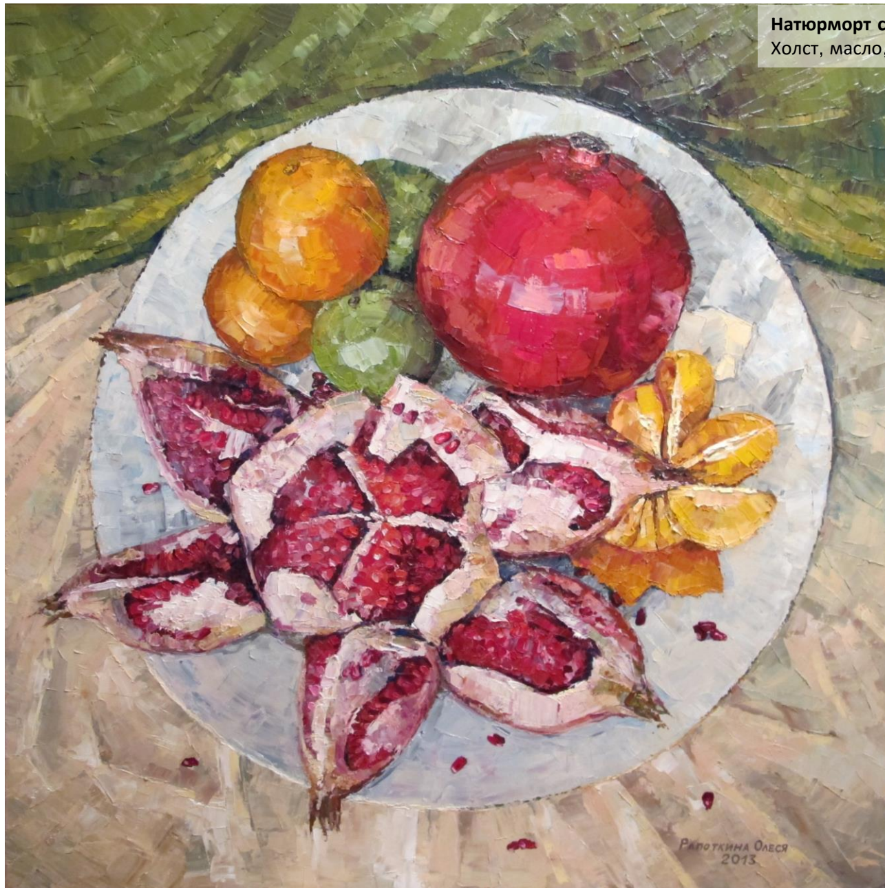
Натюрморт с гранатами Холст, масло, 100x100 см, 2013