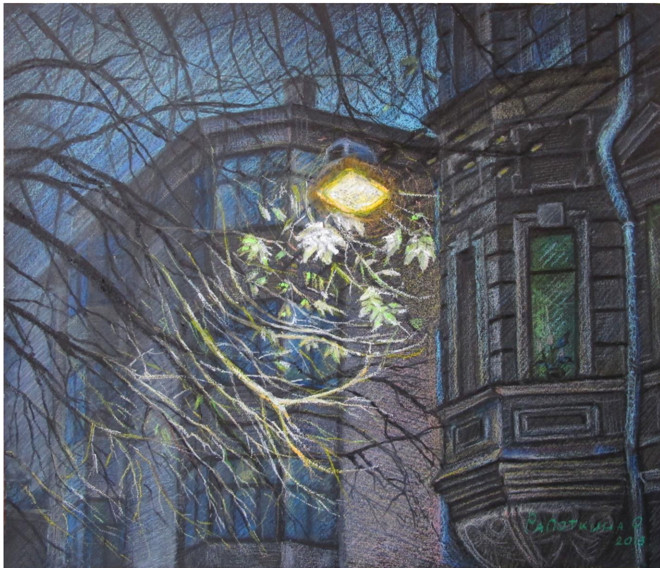
Вечер в Большом Харитоньевском переулке. Москва Картон, масляная пастель, 69,5x60 см, 2013