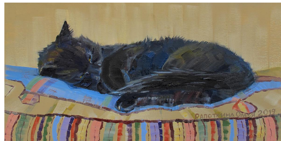
Дуня на подушке Холст на оргалите, масло, 50x25 см, 2019