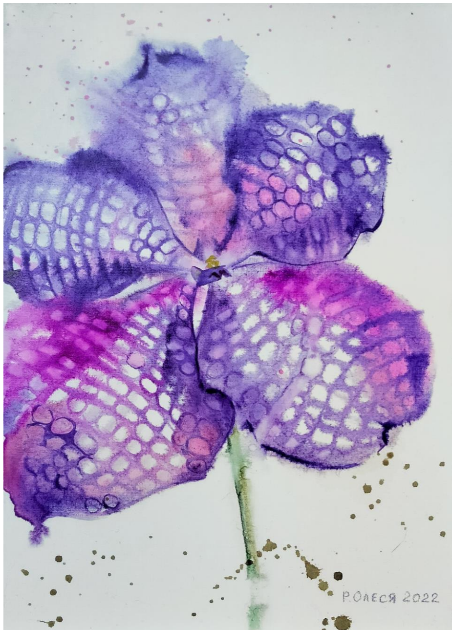
Орхидея Ванда Холст для акварели, акварель, 25x35 см, 2022