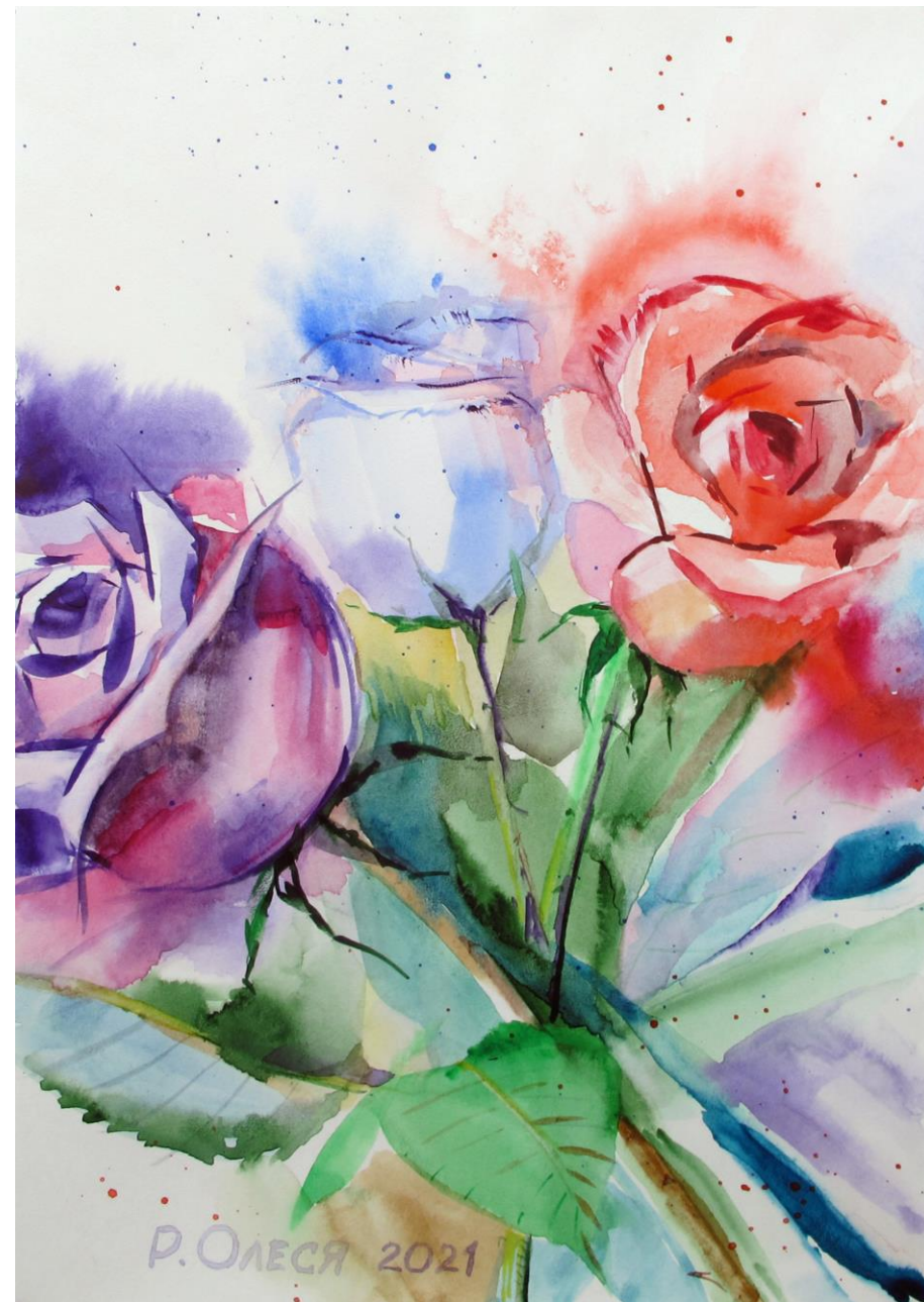
Розы Бумага, акварель, 21x29,7 см, 2021