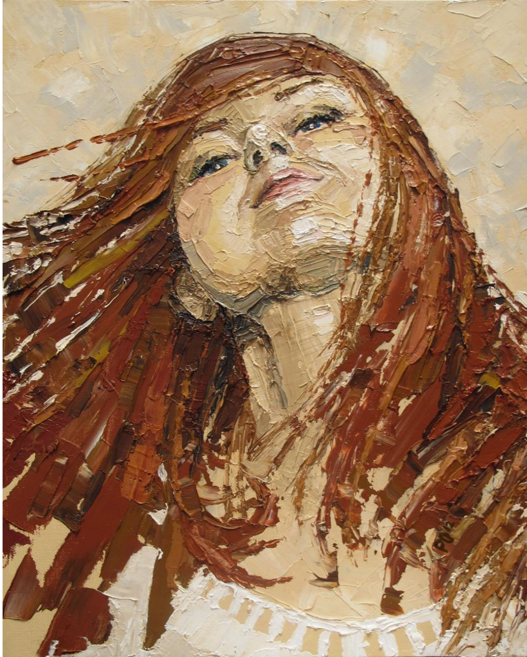
Автопортрет мастихином Холст на картоне, 40x50 см, 2012