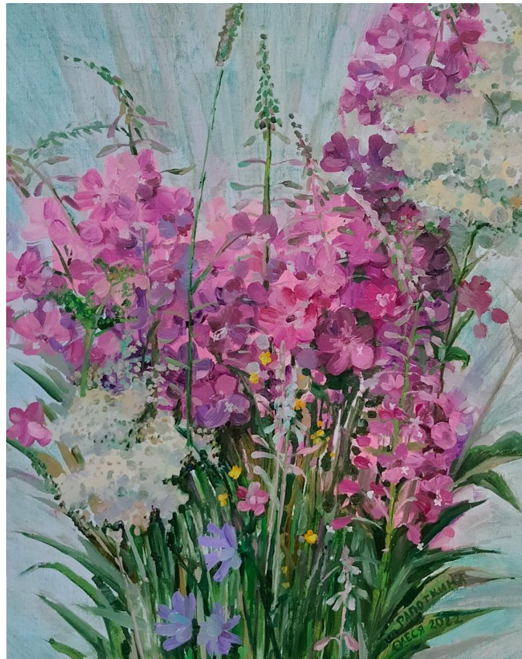
Полевые цветы Холст, масло, масляная пастель, 40x50 см, 2022