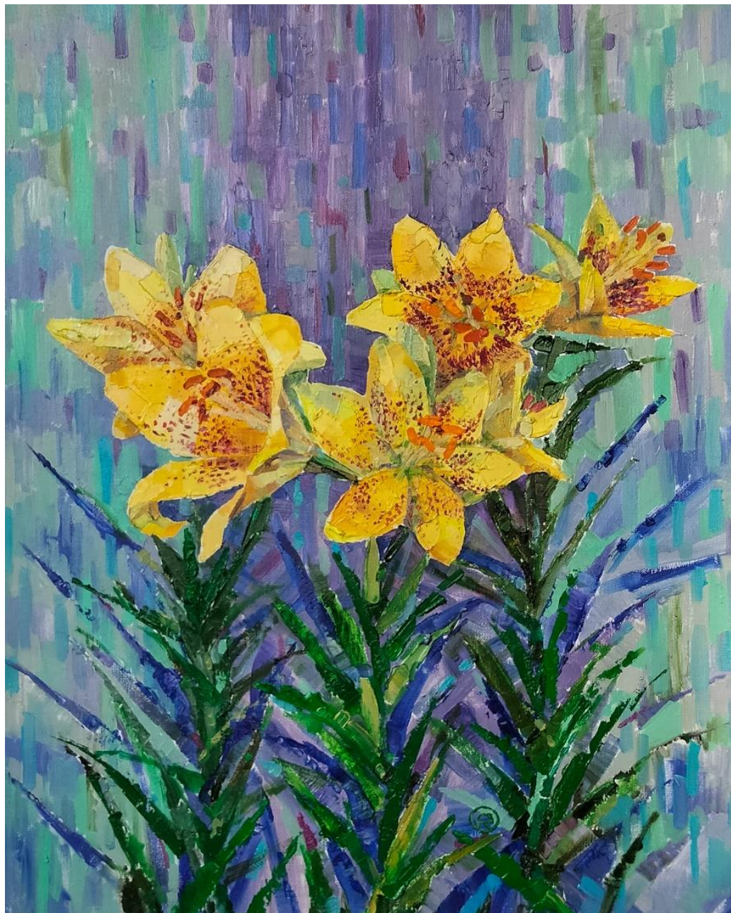
Желтые лилии Холст, масло, 40x50 см, 2022