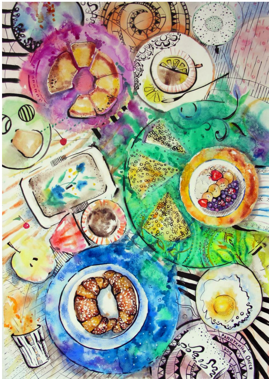
Завтрак Серия из 2х работ. Акварель 1. Бумага, акварель, 59,4x84,1 см, 2018