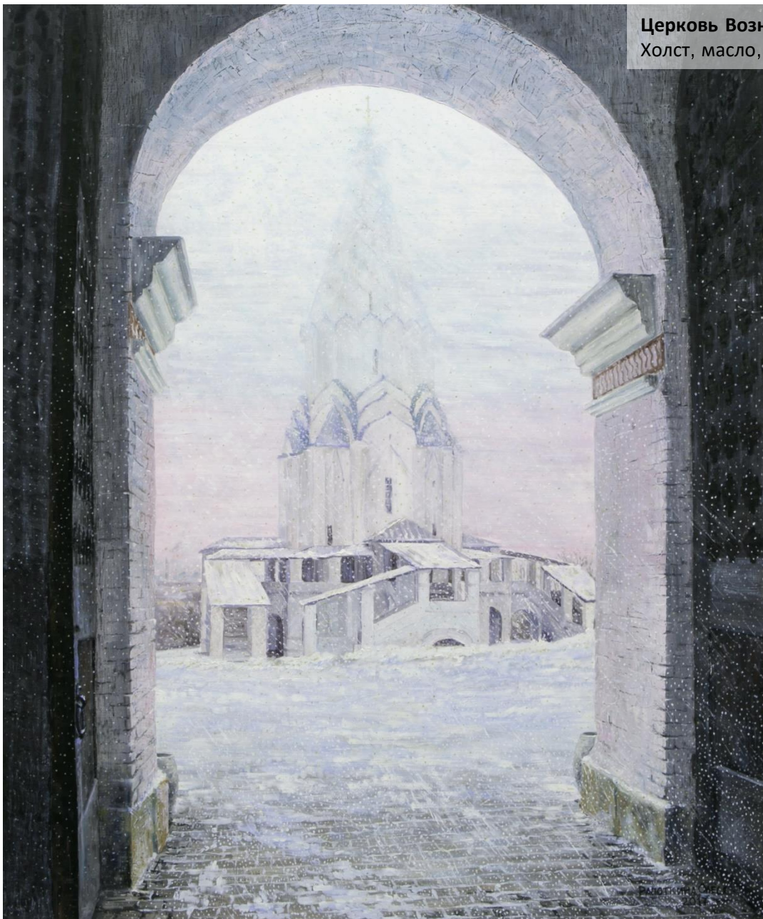
Церковь Вознесения Господня Холст, масло, 100x120 см, 2017